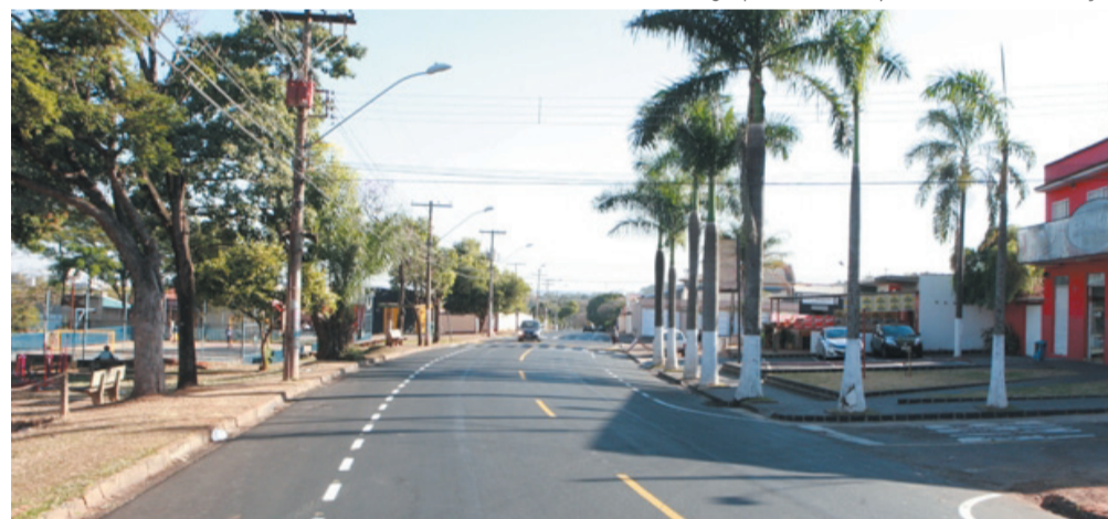
Avenida Comendador Alexandrino Garcia